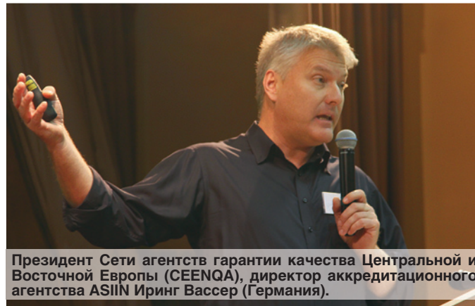
Президент Сети агентств гарантии качества Центральной и Восточной Европы (CEENQA), директор аккредитационного агентства ASIIN Иринг Вассер (Германия).