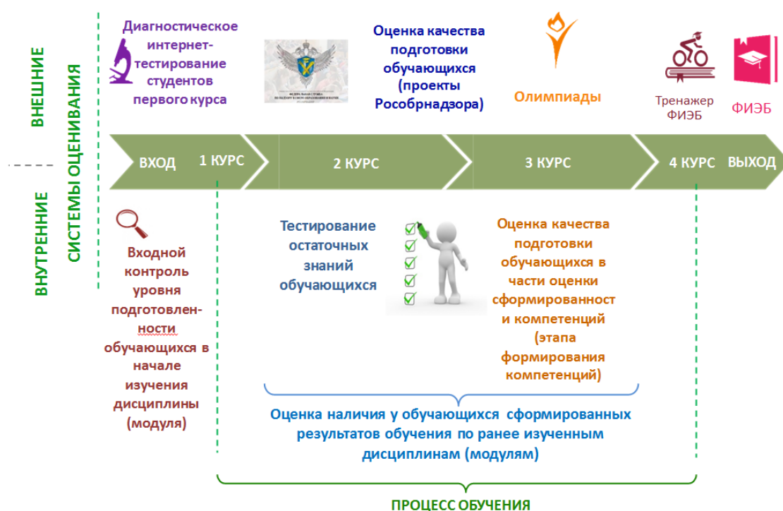
Рис. 3. Независимая оценка качества подготовки обучающихся Fig. 3. Independent assessment of the students training quality